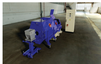
Gama Alpha Gyra Para piezas desde 100 kg hasta más de 5000 kg