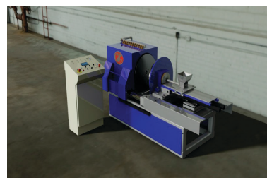
Gama GML Para revestimientos de metal blanco/Babbitt