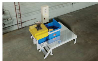
Máquinas de Eje Vertical Desde casquillos a rodillos de laminación. Montadas a nivel de suelo o sobre foso según tamaño