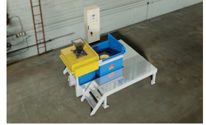
DİK EKSENLİ MAKİNELER Ölçüsüne göre zemine veya çukura yerleştirilmektedir. Burçlardan Merdane üretimine kadar geniş bir yelpazede Parça üretiminde kullanılabilir.