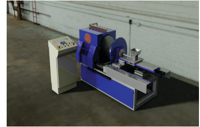
GML MACHINE RANGE Çift kitleme sistemi vardır. Mil yatak kaplama / Babbitt uygulanmasında kullanılır.