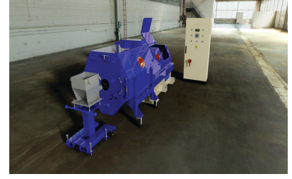
ALPHA GYRA SERİSİ 100 Kg ile 5000 Kg arasında parça üretiminde kullanılabilir.